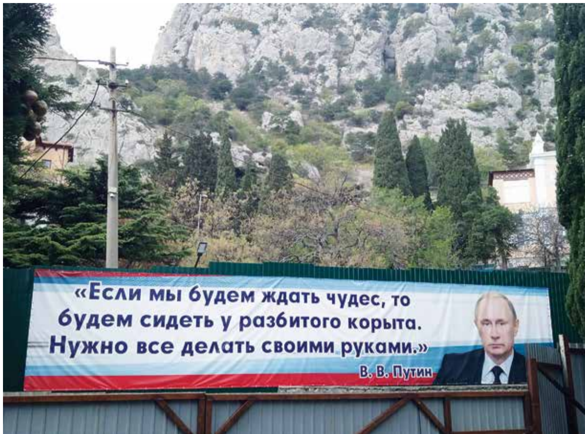
Вот такой призывающий к действиям и созиданию плакат висит на улице Советской в Симеизе.

№4(110) ИЮЛЬ 2023 г. РЕСПУБЛИКАНСКАЯ ПАТРИОТИЧЕСКАЯ ГАЗЕТА